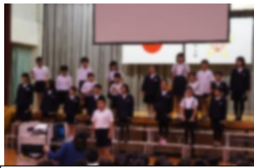
美しい言葉 ～古文・敬語の使い方～