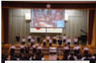
がんばってるよ1年生

11月8日(金)の学習発表会では、保護者の皆様、地域の皆様には御多用の中、多数御参観いただき、ありがとうございました。子どもたちは緊張しながらも、参観者に見守られながら、生き生きと練習の成果を発揮できたようです。子どもたちが考えた本年度の学習発表会のめあては「みんなにわかりやすく発表しよう」と「ほかの学年の発表のいいところを見つけよう」でした。どの学年も、写真や絵を見せたり、劇を交えたり、などして見る人にわかりやすく伝える方法を工夫していました。また、発表会の最後には感想発表の場がありましたが、全員、自分や友達の発表の良かったところを発表することができていました。発表会のめあてが達成できて、本当に良かったと思っております。